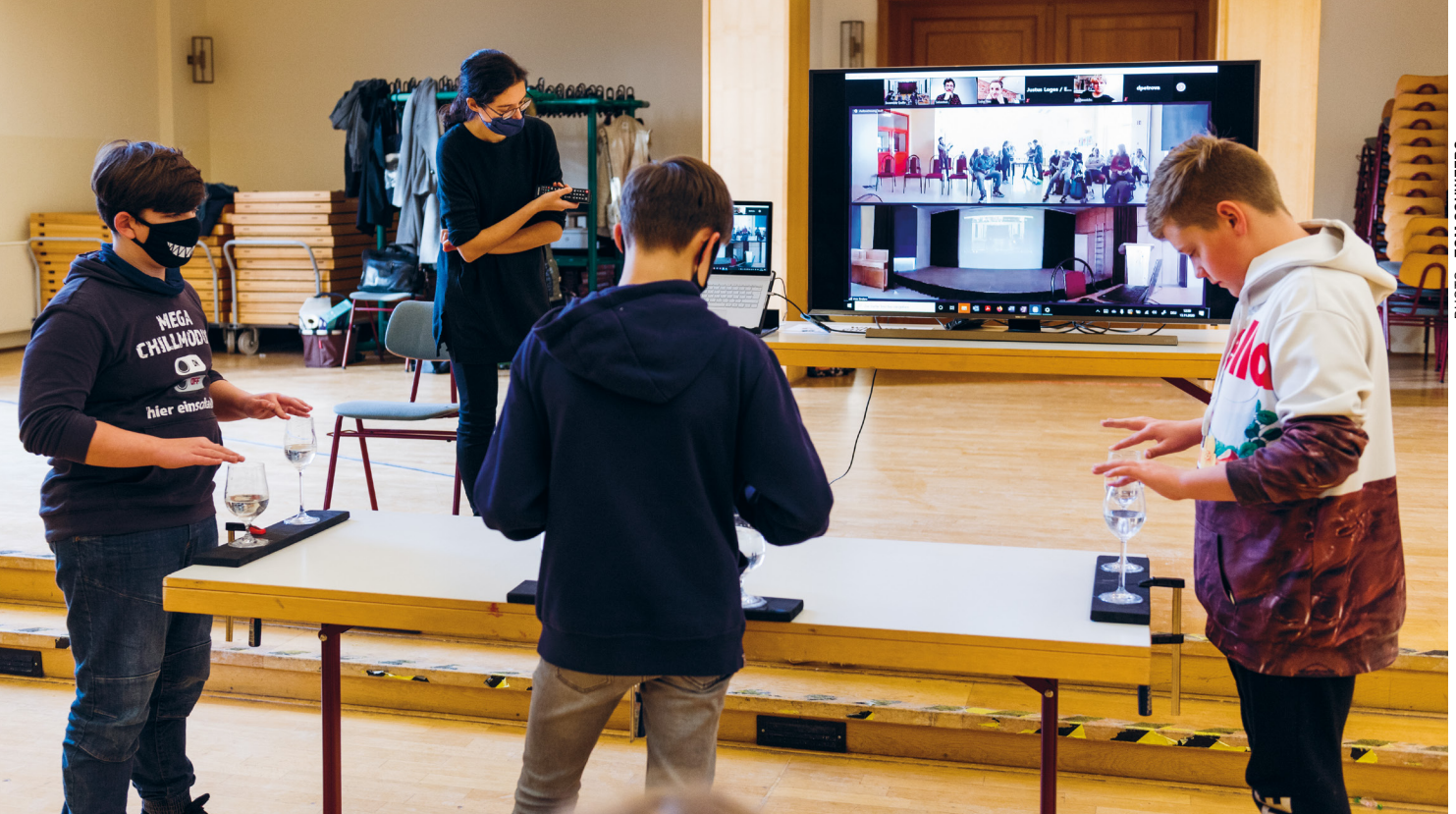
Des jeunes réalisent leur propre production de théâtre musical dans le cadre d'un atelier hybride de Quillo e.V.

Ces exemples montrent comment nos organisations partenaires ont adapté leur travail à la nouvelle situation afin de soutenir le mieux possible les participant-e-s aux projets.